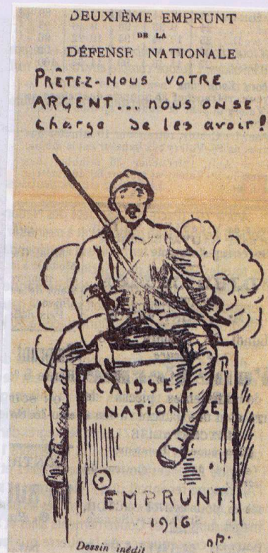
Annonce publiée dans le journal Le Littoral de la Somme , 21 octobre 1916.