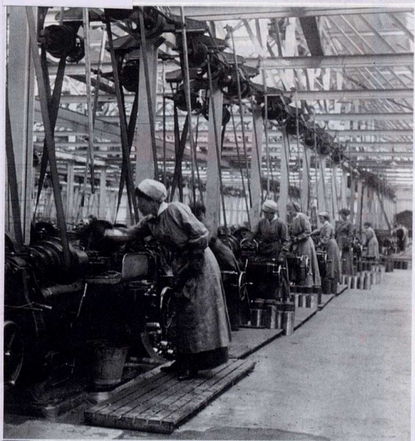
Munitionnettes en Angleterre.