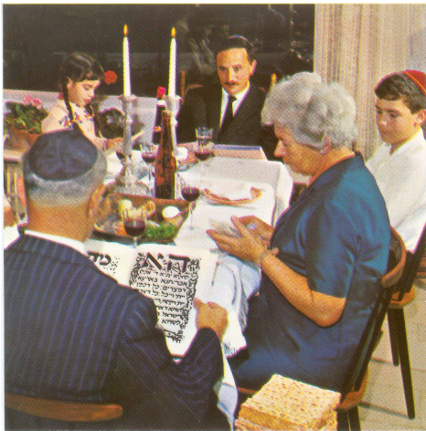
Pesach (Passover) Celebrating the Seder