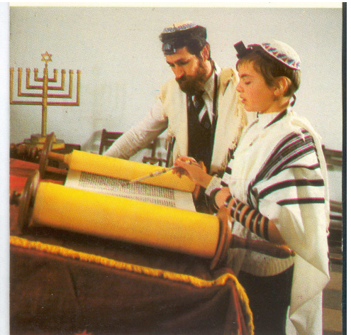
Bar Mitzvah 13 year old boy