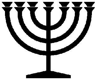
La Ménorah (le chandelier à 7 branches)