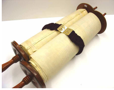
Le Sepher Torah (les rouleaux de la Torah)