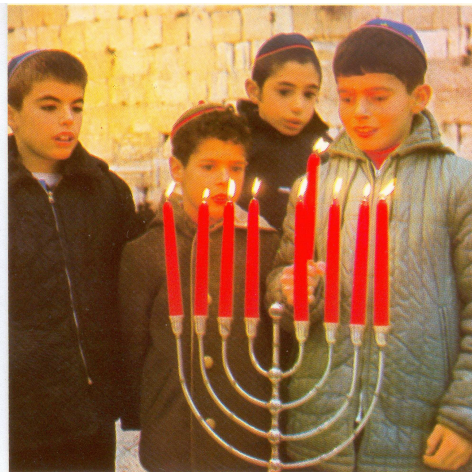
Hannukah Festival of Lights